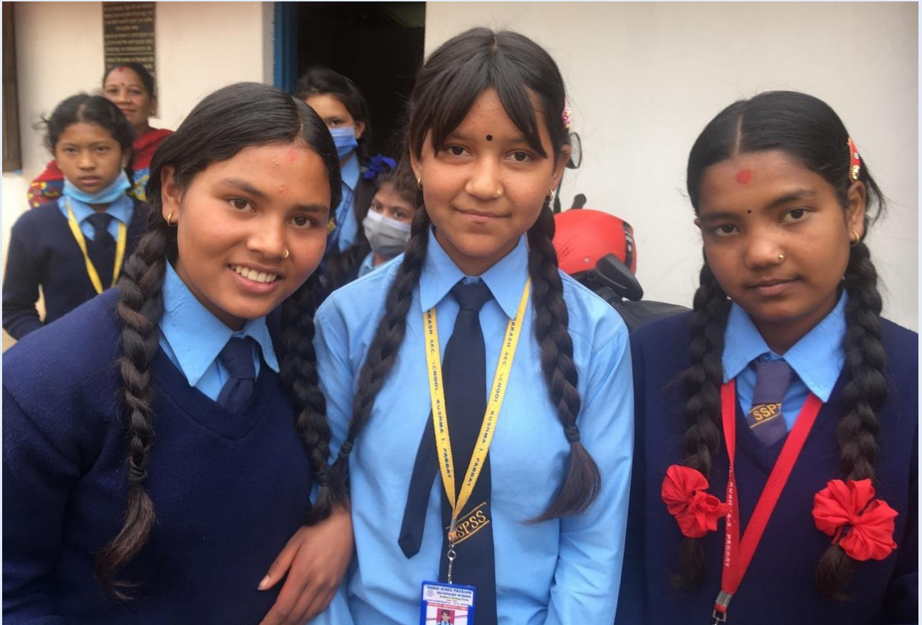
Elever på skolan i Durlung, Nepal, som FadderbarnsFonden stödjer sedan 2014.