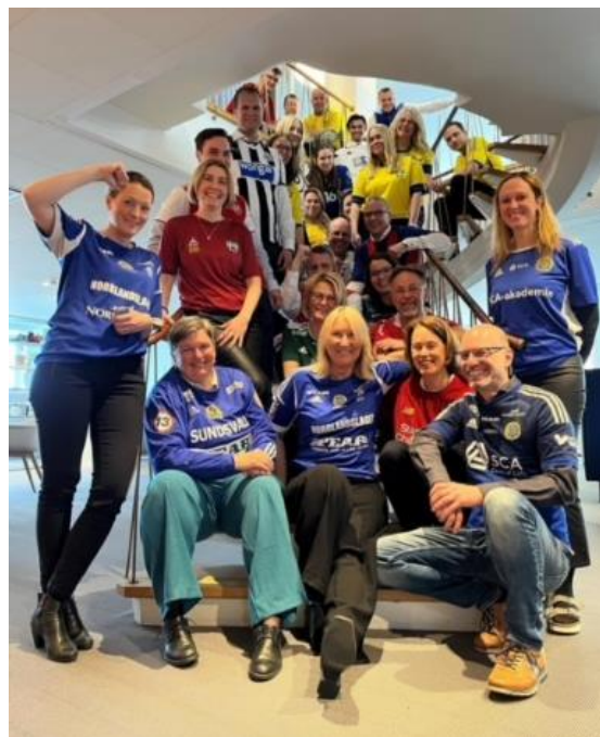
Medarbetare Handelsbanken i Sundsvall

Om människor sprang, cyklade, promenerade runt sjön spelade ingen roll. Och inte heller om man hellre ville sätta sig på en bänk och njuta av det vackra vädret.